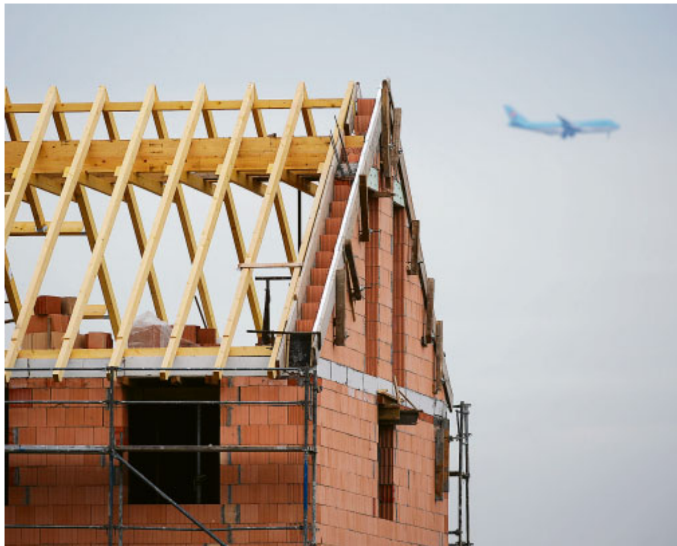
Rhein-Main baut: Der Ballungsraum ist ein Zuzugsgebiet – und braucht Platz für Wohnungen und Häuser.

Auf Wunsch von CDU und FDP soll der Kreisausschuss zudem noch nachträglich eine Stellungnahme zum Teilplan Erneuerbare Energie des Regionalplans Südhessen verfassen und sich auf seine Meinung von 2012 rückbesinnen, wonach das Obere Mittelrheintal, der Wipertaaunus sowie der Taunuskamm generell von Windkraftanlagen freizuhalten seien. OLIVER BOCK